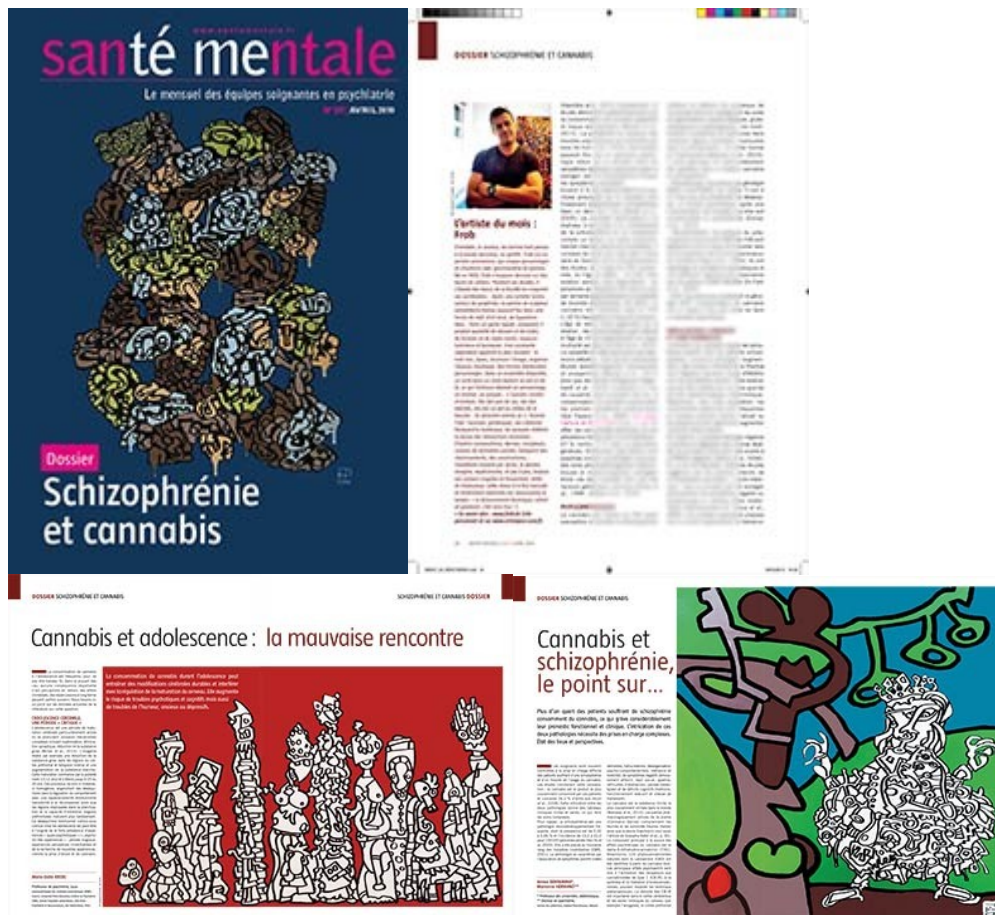
Illustration du dossier "Schizophrénie et cannabis" à travers une vingtaine de reproductions.

Santé mentale magazine n°237 avril 2019. consulter .